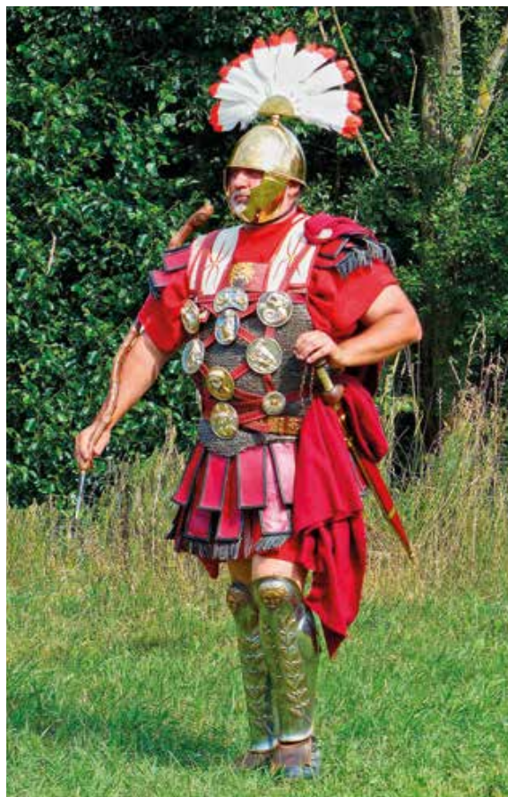
Centurion de l'armée romaine, époque de la guerre des Gaules. Il arbore avec fierté sur sa cote de mailles, les récompenses honorifiques que sont les phalères. Comme tous les centurions il porte le glaive à gauche et tiens dans sa main droite, le vitis en cep de vigne, symbole omniprésent de son autorité. Il porte également un casque de type Montefortino tardif sans décorations, avec une crista traversa en plumes. Notons également la présence de belles jambières richement décorées.

Curieusement, il écrit dans ses Commentaires, qu'avant de se mettre en route vers le pays des Boïens, il leur envoie une ambassade pour les prévenir de son arrivée. Mais c'est la direction de l'ouest qu'il prend et non celle de Gorgobina . Il faut donc sans doute ici voir, dans les intentions de César, une ruse censée faire croire à l'adversaire qu'il va à sa rencontre, ce qui lui laisse le temps d'agir ailleurs. Avec sa célérité habituelle, il mène une guerre éclair pour faire pression sur les alliés de Vercingétorix et les détacher de l'alliance.